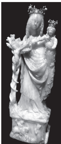
Fot. 4. Madonna św. Jacka Odrowąza, ok. 1400 r.