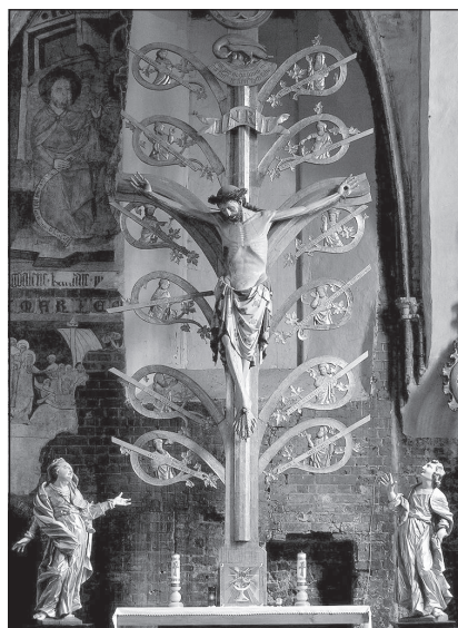
Fot. 3. Krucyfiks Drzewo Życia w kościele św. Jakuba w Toruniu, koniec XIV w.

wane pędy i liście winorośli 20 . Ukrzyżowanego Zbawiciela otaczają umieszczone w gałęziach krzyża portrety dwunastu starotestamentowych proroków z trzymanymi przezeń inskrypcjami, zapowiadającymi nadejście Mesjasza 21 . Natomiast ponad titulusem , a konkretnie na jego osi, widnieje symbolizujący Odkupiciela pojącego chrześcijan swą krwią pelikan, który karmi pisklęta własną krwią, płynącą z rozdartej dziobem piersi. Interesujące jest też to, że w ową kompozycję wpisuje się krzyż widlasty, niejako osadzony na Drzewie Życia. Krzyż mistyczny jako Drzewo Życia nie zawsze jest zatem samodzielny przedstawieniem.