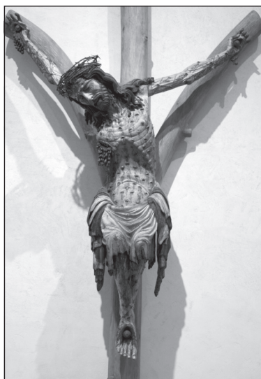
Fot. 1. Krucyfiks widlasty z kościoła Bożego Ciała we Wrocławiu, ok. 1350 r.